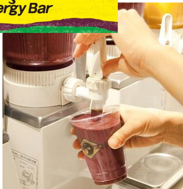
スムージーの飲用理由